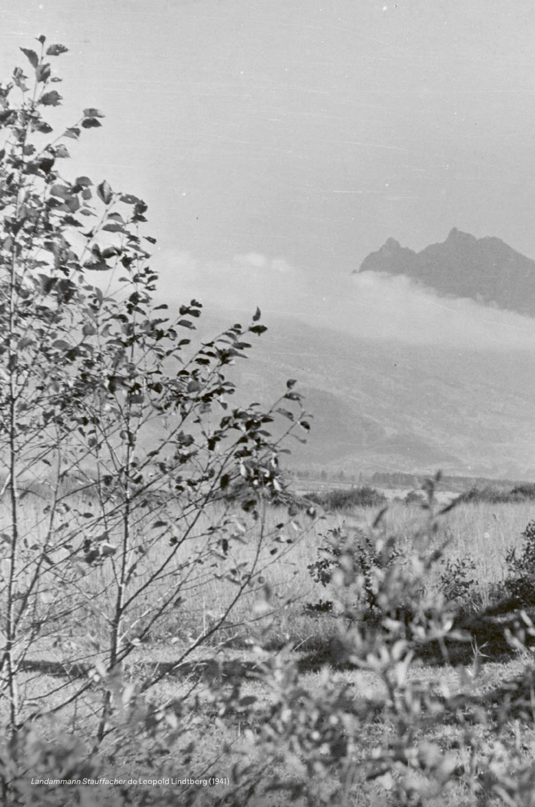
Landammann Stauffacher de Leopold Lindtberg (1941)