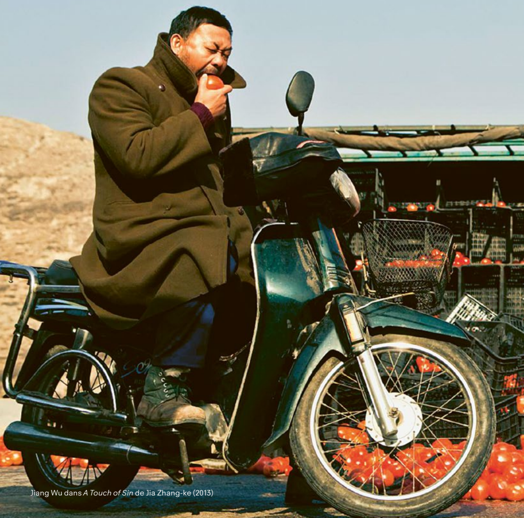
Jiang Wu dans A Touch of Sin de Jia Zhang-ke (2013)