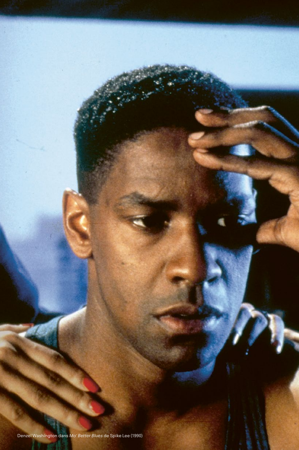
Denzel Washington dans Mo' Better Blues de Spike Lee (1990)