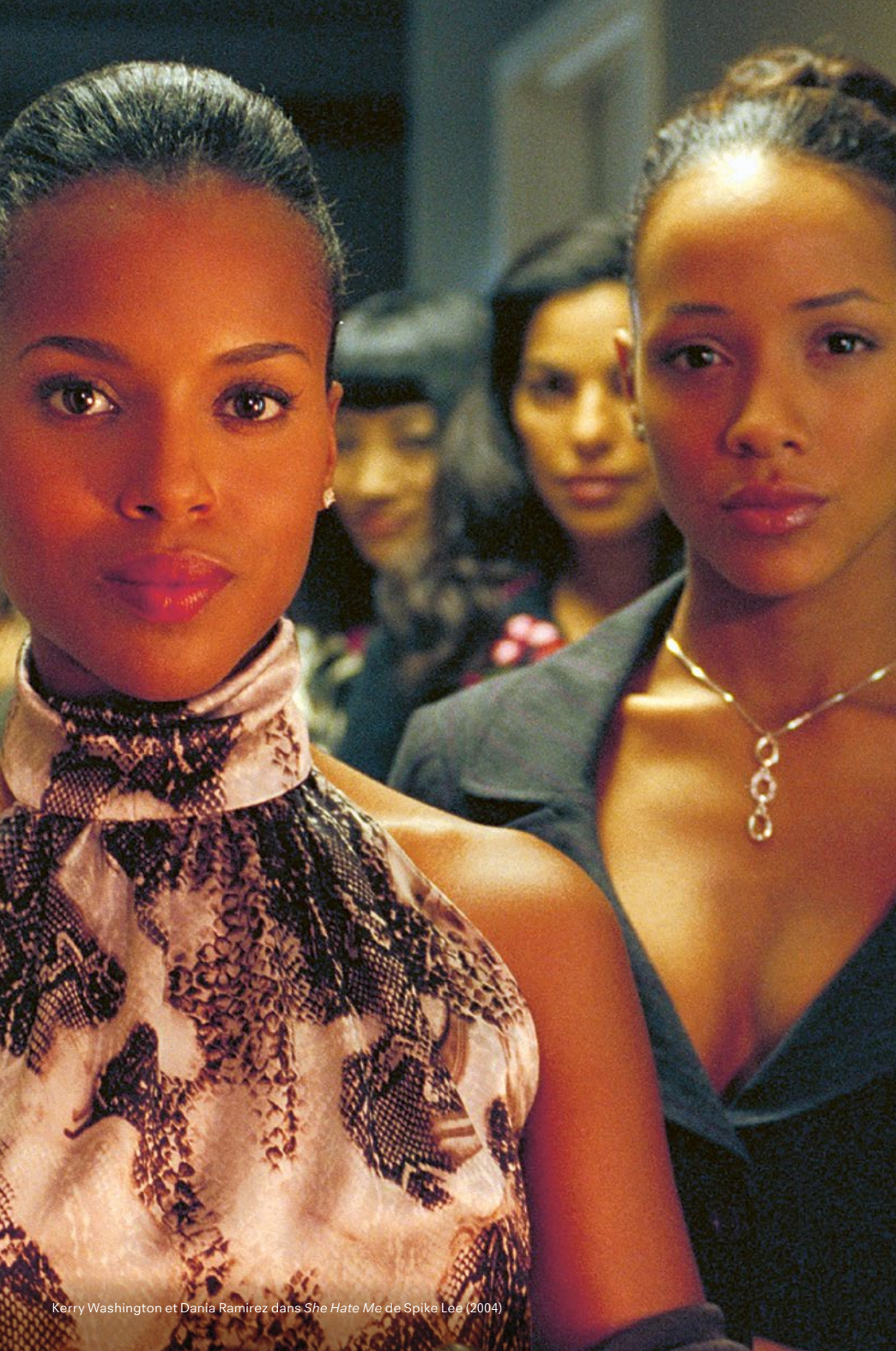
Kerry Washington et Dania Ramirez dans She Hate Me de Spike Lee (2004)